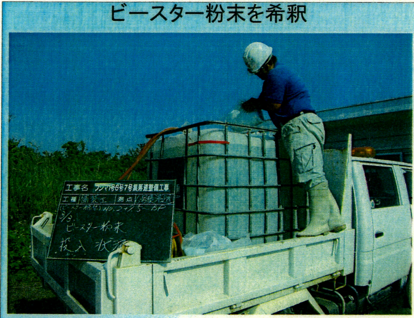
ビースター粉末を希釈