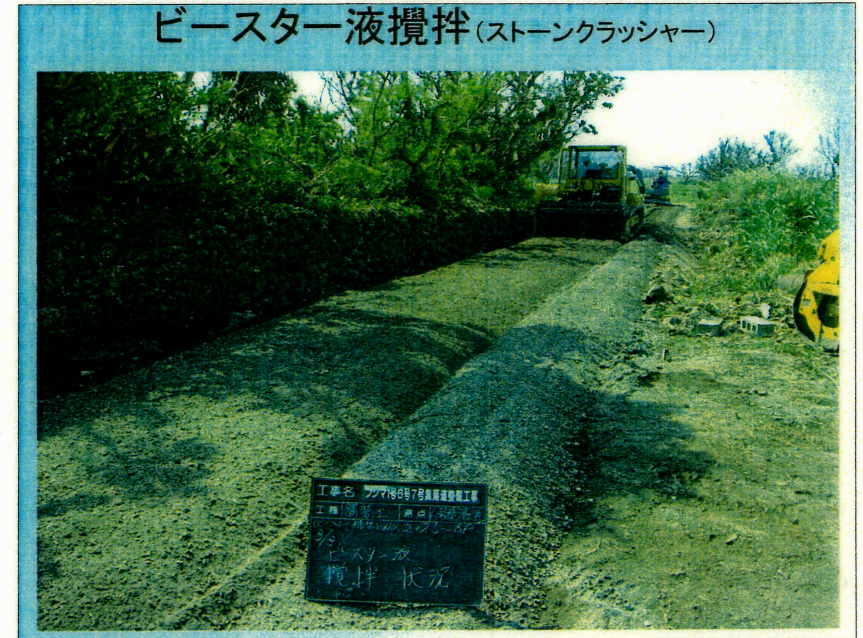
ビースター液攪拌(ストーンクラッシャー)