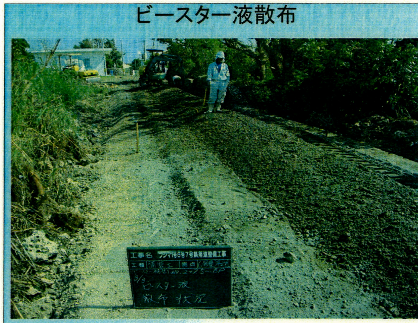
ビースター液散布