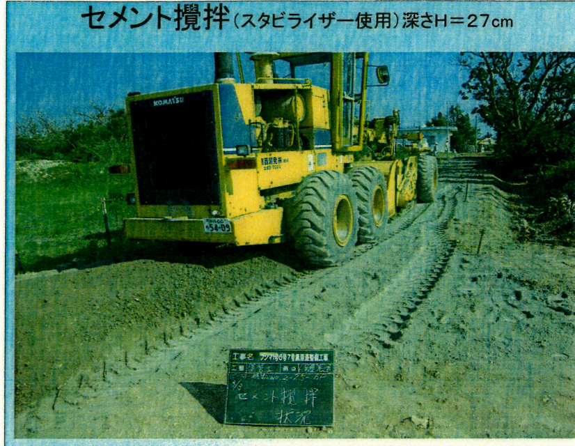
セメント攪拌(スタビライザー使用)深さH=27cm